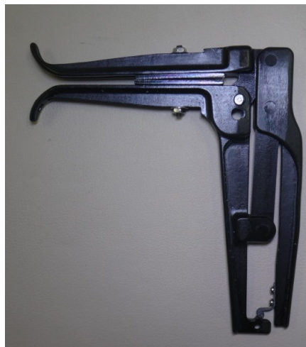
スリーブクリッパー(分岐用)